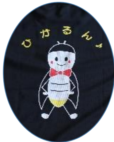
三和小学校 イメージキャラクター 「ひかるん♪」